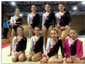
Les 11-15 ans ont concouru samedi en N6.

La Cartusienne gymnastique féminine, pour la première compétition de l'année, a présenté cinq équipes ce week-end aux Départementaux Ufolep de L'Isle-d'Abeau. Pour la plupart d'entre elles, les gymnastes qui ont environ deux ans de pratique, effectuaient leur première compétition. Elles ont présenté beaucoup de belles choses mais il y a eu aussi un peu d'appréhension pour une première face au public.