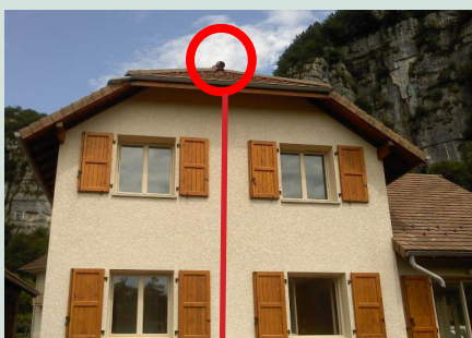
Ventilation secondaire conforme