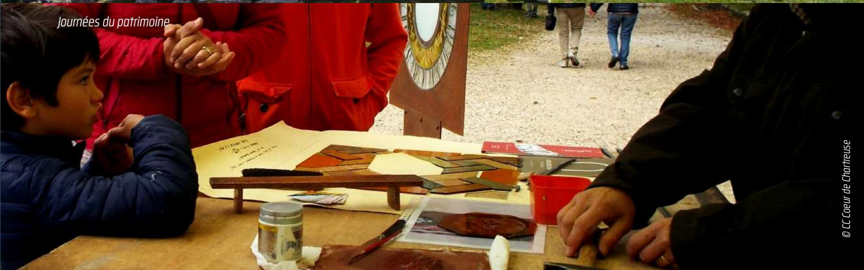
Journées du patrimoine