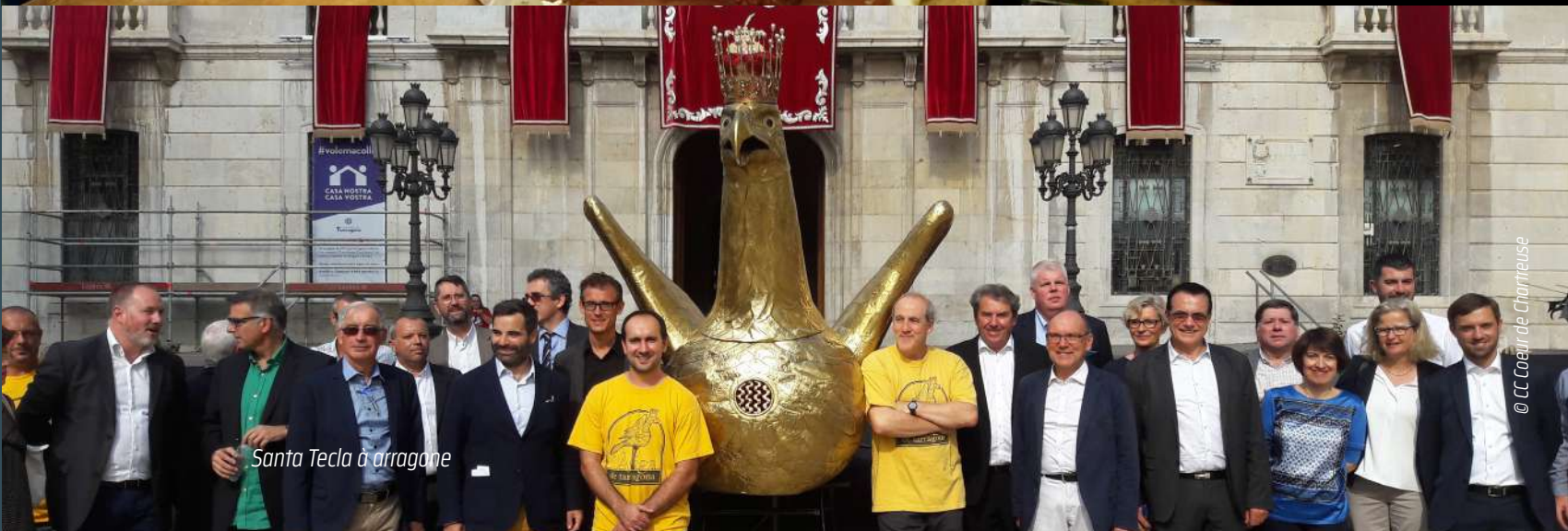
Santa Tecla à arragone