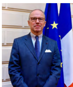
Pascal Mailhos, préfet de la région Auvergne-Rhône-Alpes, préfet du Rhône

Présenté le 3 septembre 2020, le plan de relance se déploie aujourd'hui sur notre territoire, avec de premiers effets concrets. Nous pouvons d'ores et déjà nous féliciter que notre région y figure à sa juste place, tant dans