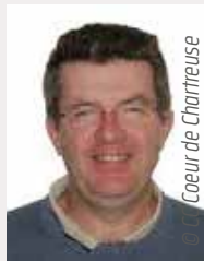
Coeur de Chartreuse