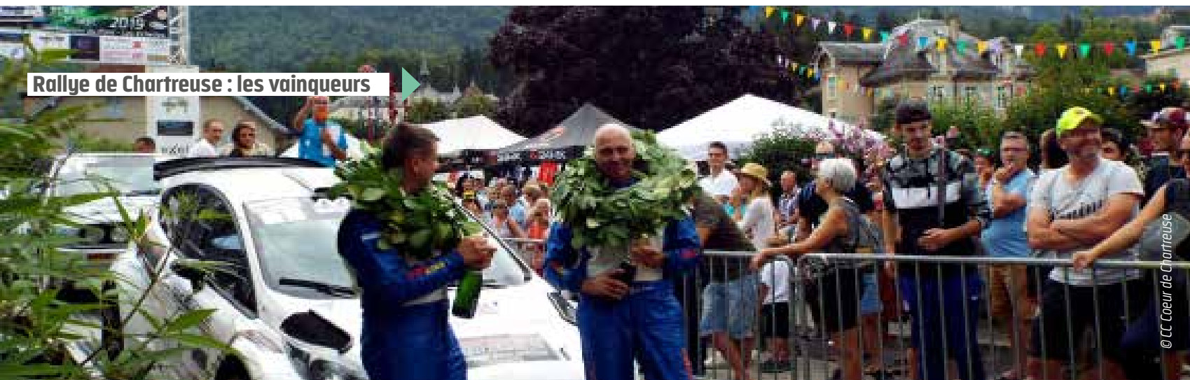
Rallye de Chartreuse : les vainqueurs