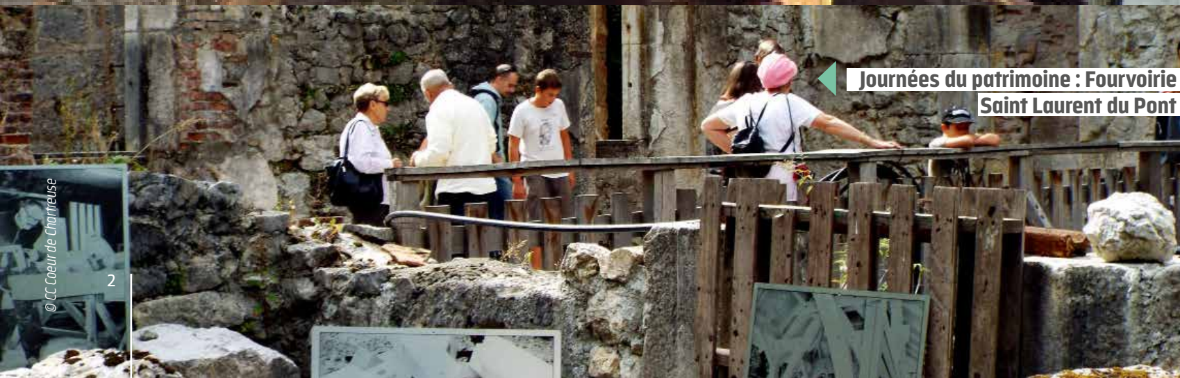
Journées du patrimoine : Fourvoirie Saint Laurent du Pont