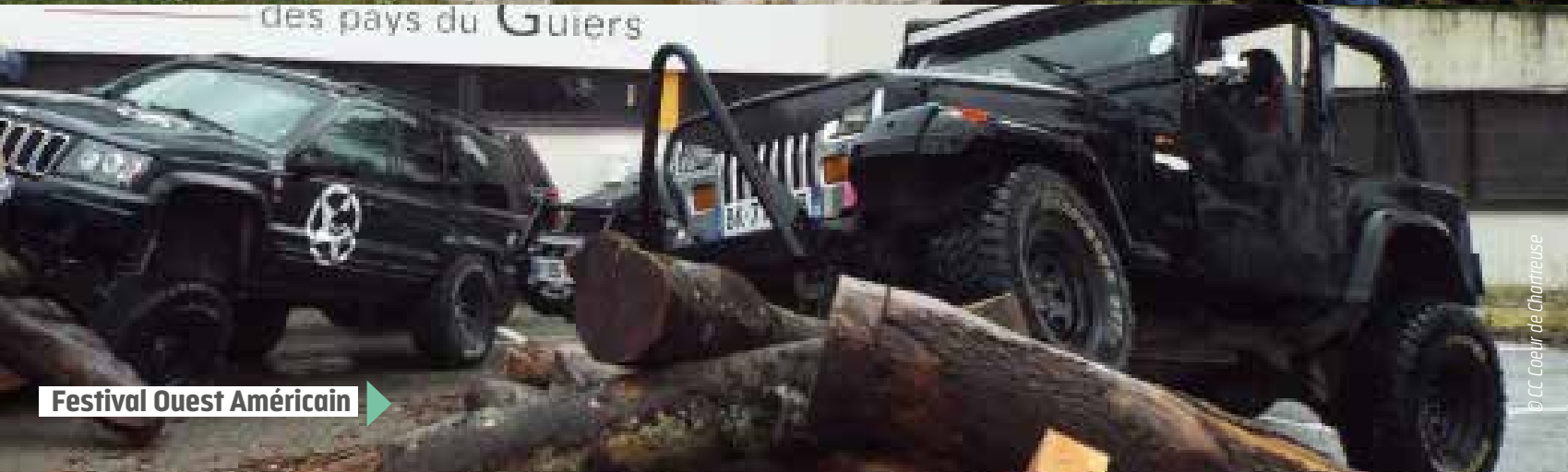
Festival Ouest Américain