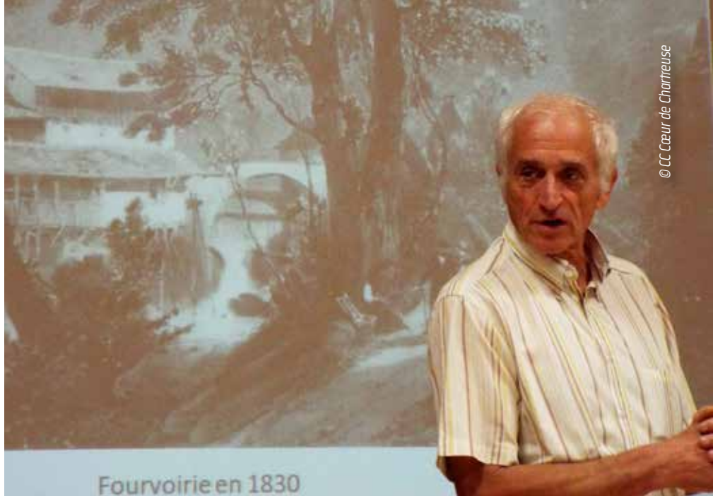
Fourvoirie en 1830