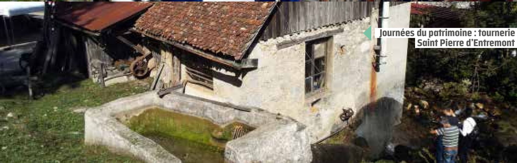
Journées du patrimoine : tournerie Saint Pierre d'Entremont